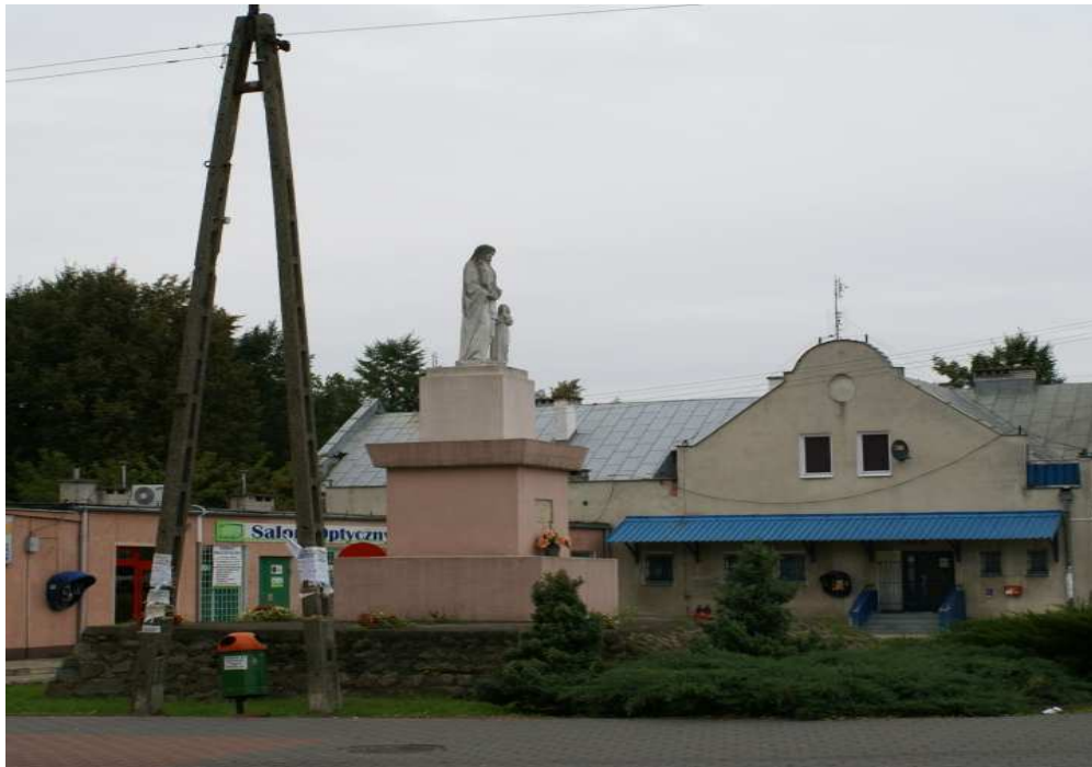
Rys. 5 Figura św. Anny

Znaczenie sentymentalne ma posadowiona u zbiegu ulic Nasielskiej i Serockiej figurka św. Anny z napisem „Dzieci kochajcie i szanujcie matki wasze tą miłością rosną i szlachetnieją wasze serca św. Anno módl się za nami” figura ufundowana została w roku 1938 staraniem Polskiego Czerwonego Krzyża w Pomiechówku.