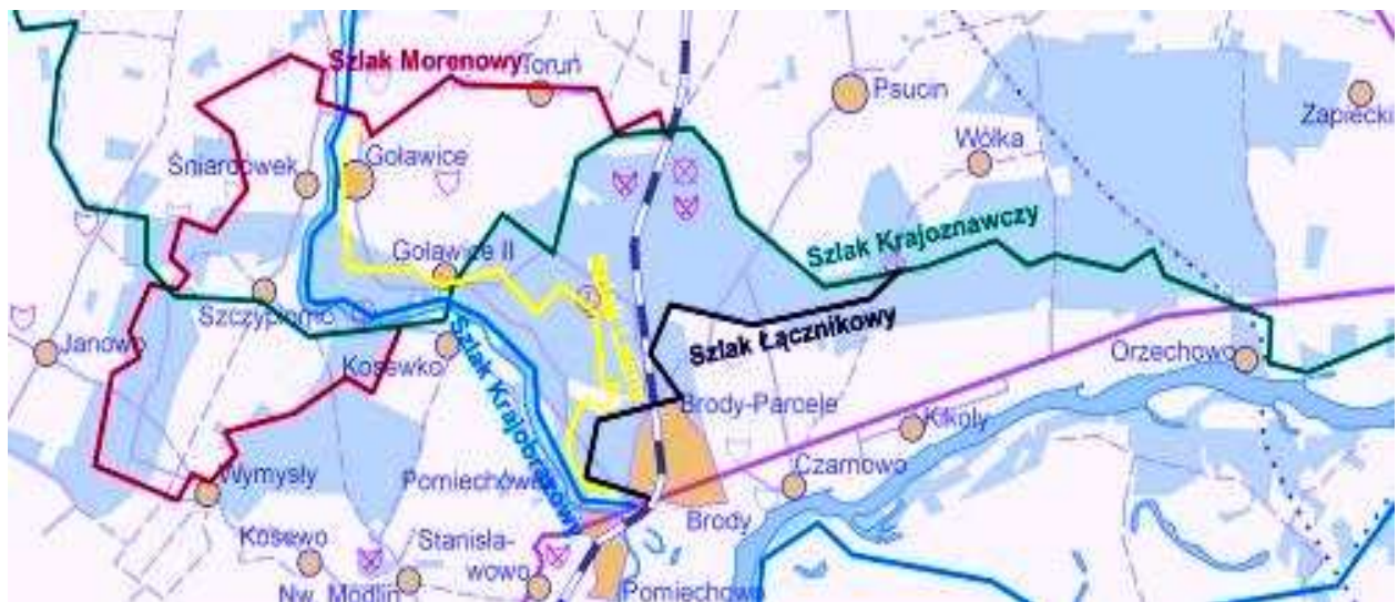
Rys.2. Mapa szlaków turystycznych w Gminie Pomiechówek

Pomniki przyrody – Sosna zwyczajna przy ul. Nasielskiej